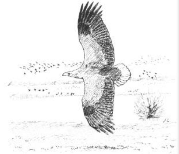
Pygargue à queue blanche

Illustrations : Jean CHEVALLIER - « Les Oiseaux de Champagne-Ardenne » - LPO (1991) & Melle C. BAGOLLE - « Sentier des Salamandres » - PNRFO-ONF (1999) & Richard THIBAUT - « Calendrier des animations nature » - PNRFO-CEPE (2000) Conception dépliant LPO & PNRFO / PvB - Mise à jour données et tarifs août 2001 Tarifs valables jusqu'au 31 décembre 2002