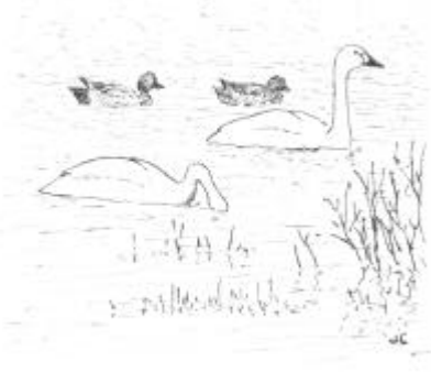
Au 1er plan : Cygne de bewick Au 2ème plan : Canard siffleur